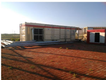
Skid integrated CNG compressor,with interstage dry dehydration system Suction pressure 0.15MPa,discharge pressure 25MPa,10,000Nm3/Day