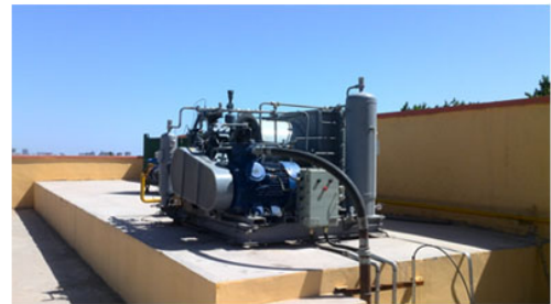
BOG compressor Suction pressure 0.01MPa,discharge pressure 25MPa,5,000Nm3/Day